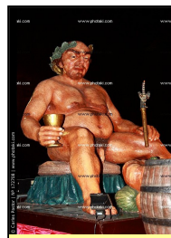
O deus Baco ou carneístoles (carnaval)

Era um nome alternativo, adotado pelos romanos, do deus grego Dioniso .